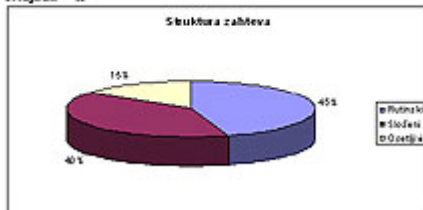
5) Upravljanje zahtevima. Ovim organima upućen je običan zahtev kojim se od organa javne vlasti tražila samo informacija, bez posebnog uvoda i dostavljanja dokumenata u koje se informacija nalazi.

U skladu sa članom 16. st. 1. Zakona o slobodnom pristupu informacijama, organ vlasti je dužan, u ovom obliku zahteva, prava na pristup informacijama, bez odlaganja, a najkasnije u roku od 15 dana dana prijema zahteva tražiocu obavestiti o postojanju informacija, odnosno da ih ne postoji. U ovom smislu, odgovornost obezbeđivanja činjenice je prema datu dostavljanja odnosno saopštavanja informacije godištem, putem faksa, telefonski svakom lokalnom podnositelju. To znači da se odgovornost obaveštavanja smatrao samo ono obaveštavanje koje je učinjeno u roku od 15 dana od dana prijema zahteva.