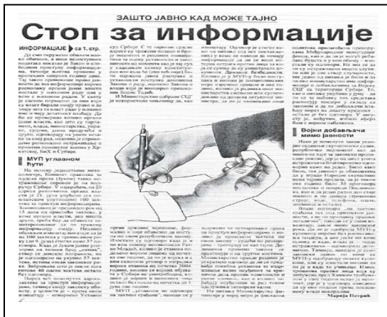
Dnevne novine Politika, 10. 12. 2005 Stop za informacije

Konačno, Predsednik Narodne skupštine Srbije je odgovorio na samo jedan od poslanih zahteva (i to na onaj koji je poslat od strane novinara) što ukazuje na mogućnost diskriminacije prema građanima i nevladinim organizacijama, što je u suprotnosti sa Zakonom koji jasno utvrđuje da je sloboda pristupa informacijama pravo koje je zagarantovano svima.