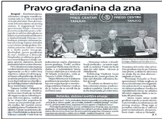
Dnevne novine Danas, 29. 09. 2005 Pravo građanina da zna

Konačni izveštaj-Srbija, izrađen od strane YUCOMovih eksperata, prikazuje istraživanje bazirano na YUCOMovoj koordinisanoj akciji i saradnji sa građanima, lokalnim nevladinim organizacijama, predstavnicima manjina i novinarima tokom juna 2005. godine, u slanju preko 100 zahteva za pristup informacijama različitim organima javnih vlasti u Srbiji.